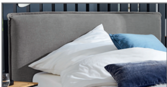
KT 3 mit umlaufender Biese