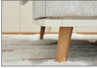
Füße und Holzrahmen massiv lackiert, Farbe sandfarbig