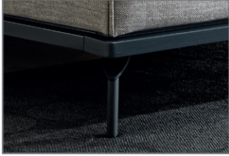
Metallfuß lackiert, Holzrahmen massiv lackiert, Farbe graphit