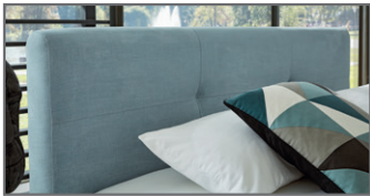
KT 1 mit 2-Punkt-Steppung