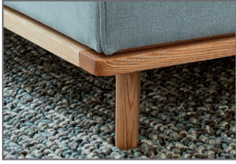
Füße und Holzrahmen massiv, eichefarbig