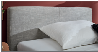
KT 2 glatt