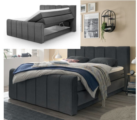
Box C Box mit Bettkasten und Fußteil (Optik wie Kopfteil)