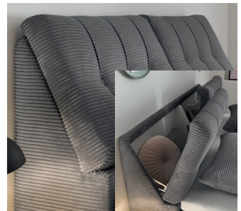
Kopfteil 03 mit Bettkasten und Knopfeinzug Höhe 109 cm