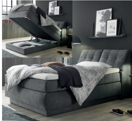
Box B Box mit verstecktem Bettkasten