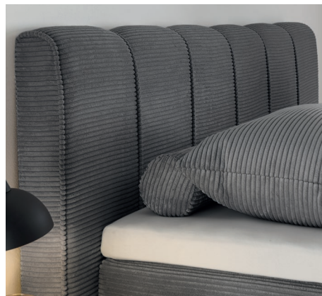
Kopfteil 02 mit senkrechter Keder Höhe 116 cm