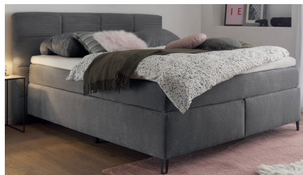
Abb. zeigt Boxspring fairfield mit Kopfteil 01 und Box A