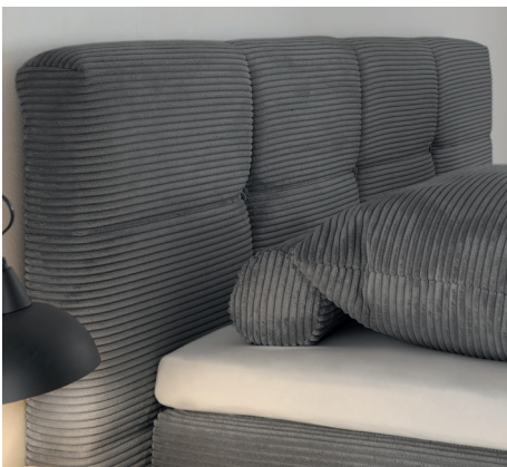
Kopfteil 01 mit Kassettenfeldern Höhe 116 cm