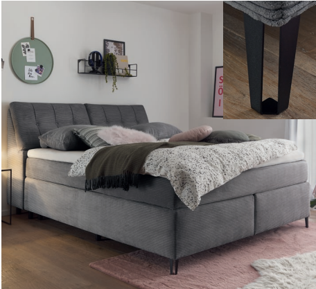
Box A Box ohne Funktion