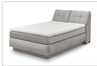
Box 14 140 x 200 cm: 1 x 140er Box (mit Bettkasten); 2 x 70er Box (ohne Bettkasten); in durchgehender Hülle 1 x durchgehende Matratze in 140 x 200 cm