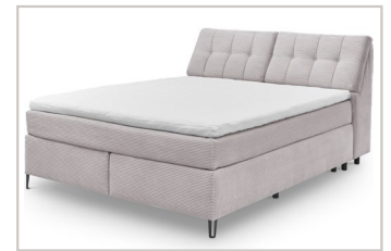
Box 18 180 x 200 cm: 2 x 90er Box; 2 x Matratze 90 x 200 cm in durchgehender Hülle