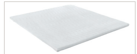
Gelkomfort-Topper Bezug waschbar bis 40°C / 75% Polyester, 25% Viskose