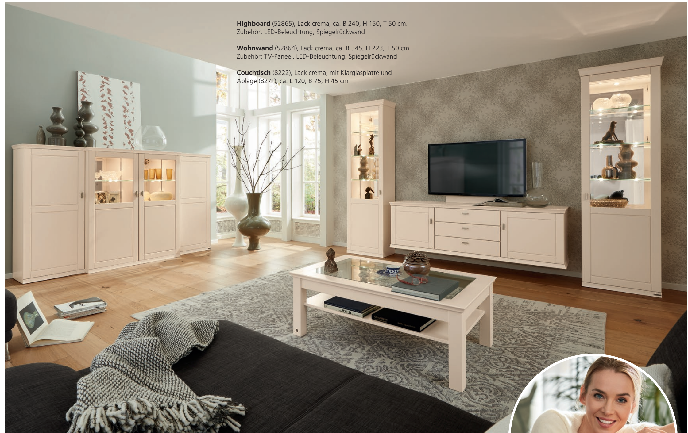
Highboard (52865), Lack crema, ca. B 240, H 150, T 50 cm. Zubehör: LED-Beleuchtung, Spiegelrückwand