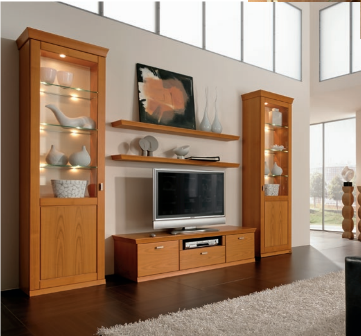
Freie Zusammenstellung (4547, 4485, 2 x 4482, 4548), Europäisch Kirschbaum furniert, Lack crema, ca. B 335, H 223, T 57 cm. Zubehör: LED-Beleuchtung

Echtholz furniere Holz sorgt mit seinen natürlichen Maserungen und Farbspielen für viel Behaglichkeit.