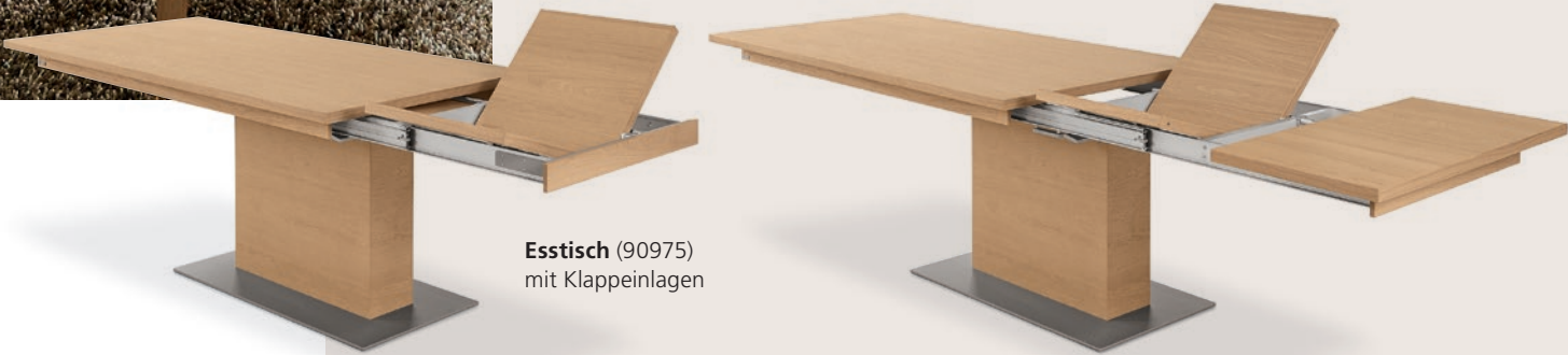
Esstisch (90975) mit Klappeinlagen

Die Lebensbereiche Wohnen und Speisen sind kaum voneinander zu trennen. Daher bietet KORSIKA auch eine größere Auswahl an Tischen, Bänken und Stühlen. Die Tische sind mit U-Wangen oder einer zentralen Säule ausgestattet und verfügen über eine Auszugsfunktion mit bis zu zwei Klappeinlagen.