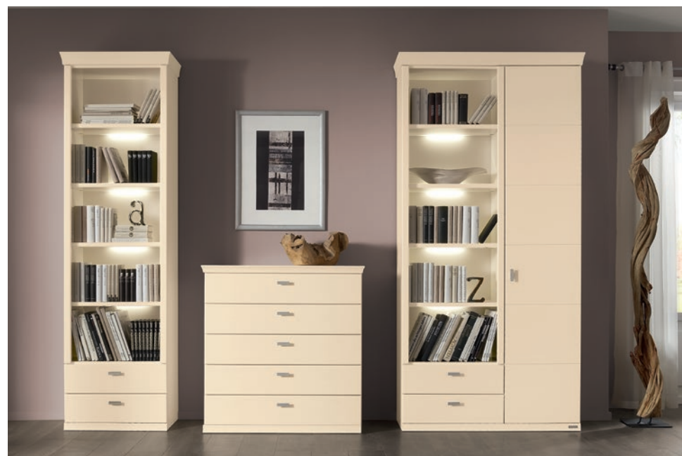
Zusammenstellung (4689, 4315, 4689, 4538), Lack crema, ca. B 283, H 223, T 50 cm. Zubehör: LED-Beleuchtung