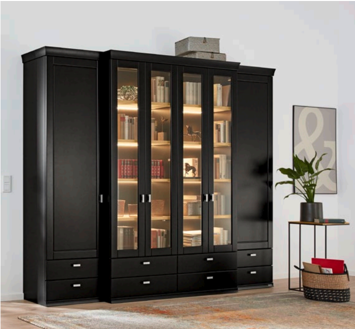
Vorschlag (52968), Lack schwarz, Eiche sand, ca. B 270, H 223, T 50 cm. Zubehör: LED-Beleuchtung