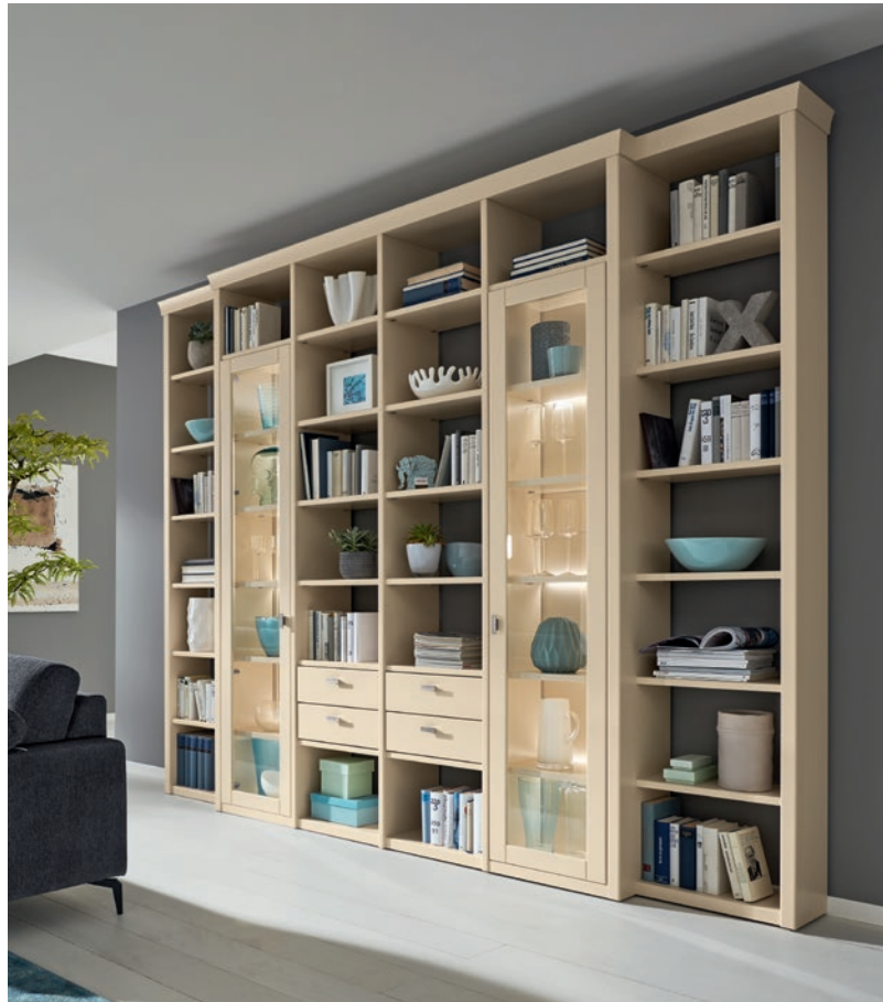
Regal (52906), Lack crema, ca. B 297, H 258, T 37 cm. Zubehör: LED-Beleuchtung