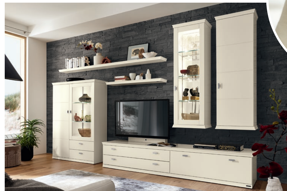
Wohnwand (52831), Lack weiß, ca. B 345, H 220, T 50 cm. Zubehör: TV-Paneel, LED-Beleuchtung, Spiegelrückwand

„Mit Musterring kann ich jeden Raum schön einrichten.“