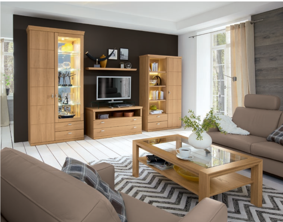
Couchtisch (90374), Eiche sand, mit Klarglasplatte und Ablage (90382), ca. L 118, B 73, H 45 cm