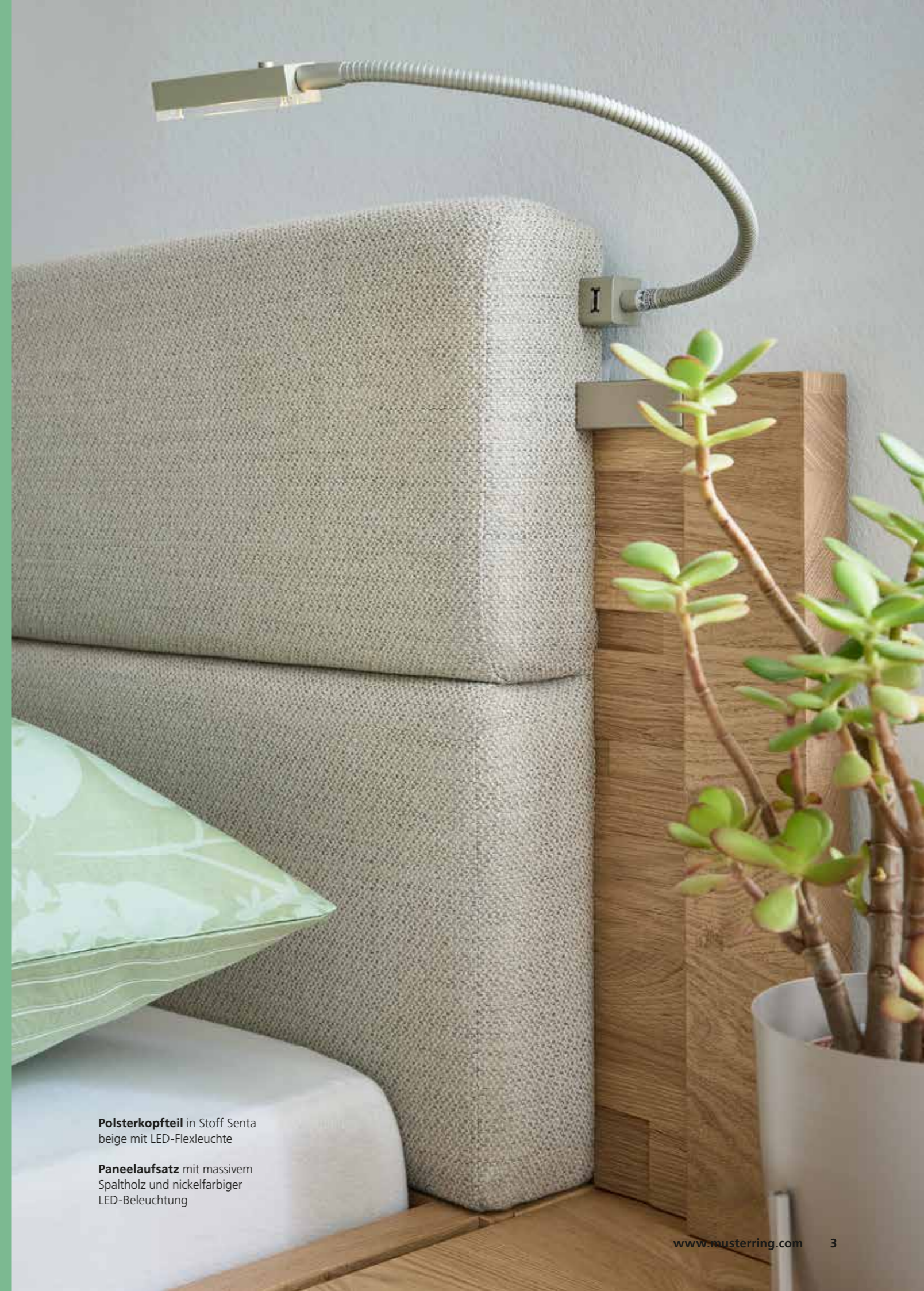
Polsterkopfteil in Stoff Senta beige mit LED-Flexleuchte

MINTO 2.0 erfüllt all diese Anforderungen mühelos. Die Kombination aus frischen Lacktönen und Balkeneiche verbindet Modernität mit Gemütlichkeit, während Spalholzeinlagen starke Akzente setzen. Die vielseitige Innenausstattung der Schränke sorgt für Ordnung und Übersicht. Dachschrägen? Sonderhöhen? Kein Problem, MINTO 2.0 passt sich an!